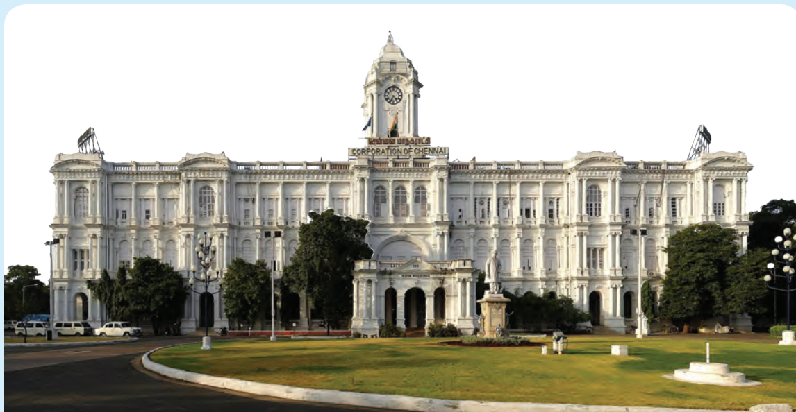
चित्र 12.3 — मद्रास कॉरपोरेशन

29 सितंबर 1688 में स्थापित मद्रास कॉरपोरेशन (अब ग्रेटर चेन्नई कॉरपोरेशन) भारत में सबसे प्राचीन नगर निगम संस्था है। ईस्ट इंडिया कंपनी ने इसके एक वर्ष पहले एक चार्टर जारी कर फोर्ट सेंट जॉर्ज नगर तथा उससे 16 कि.मी. के भीतर के सभी क्षेत्रों को एक कॉरपोरेशन में गठित किया। 1792 के एक संसदीय अधिनियम ने मद्रास कॉरपोरेशन को नगर में स्थानीय कर लगाने की शक्ति प्रदान की जिससे स्थानीय नगरीय स्वशासन सुचारु रूप में आरंभ हुआ।