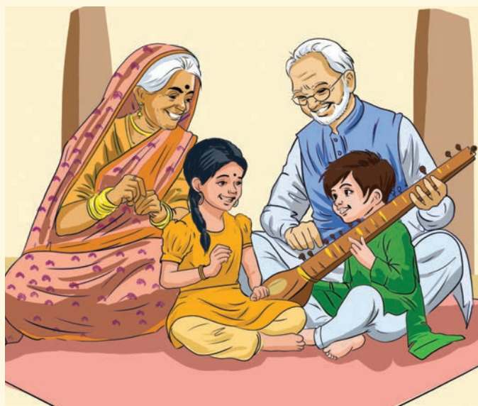
संयुक्त परिवारों के उदाहरण