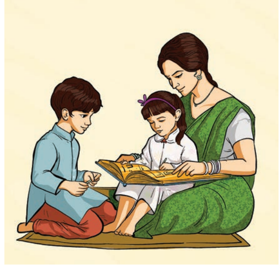
एकल परिवारों के उदाहरण

दूसरी ओर, एकल परिवार में एक दंपति और उनकी संतान होती है तथा कई बार यह अकेली माता या पिता और उनके बच्चों तक सीमित होता है।