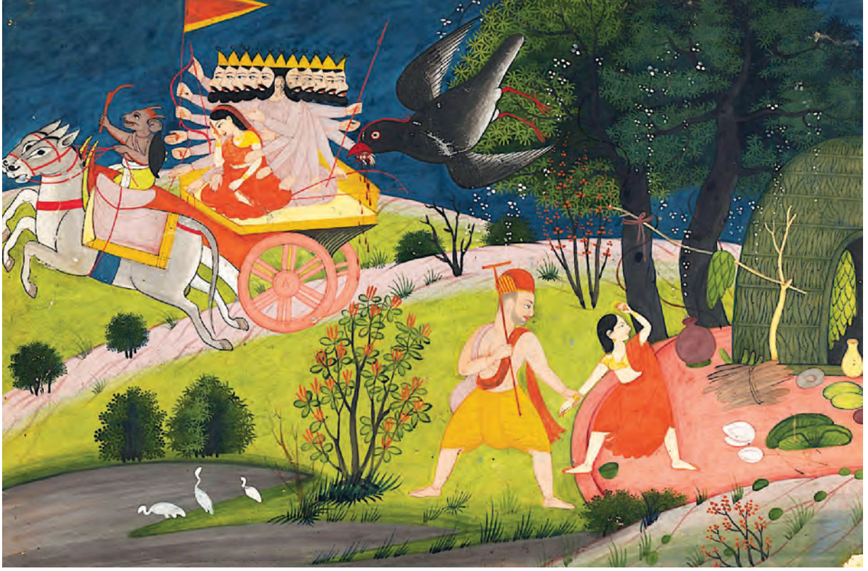
चित्र 8.6 – रामायण के प्रमुख प्रसंगों को प्रदर्शित करता हुआ चित्र (18 वीं शताब्दी, हिमाचल प्रदेश)