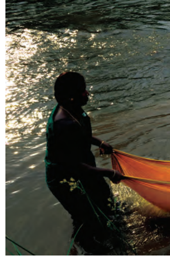
चित्र 8.4 – महिलाएँ साड़ी का प्रायः एक परिधान के अतिरिक्त अन्य प्रकार से भी उपयोग करती हैं (चित्र – दक्षिण भारत से)।