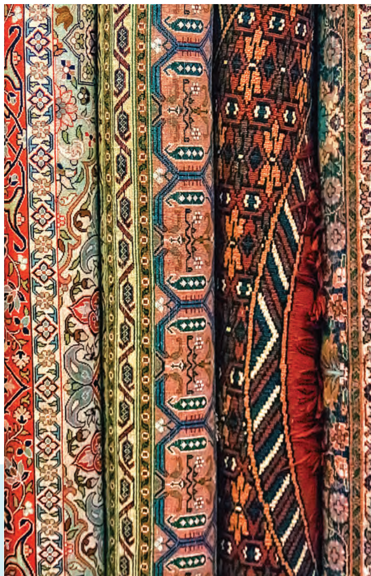
चित्र 8.3 – रंगीन पारंपरिक भारतीय कपड़ों के कुछ उदाहरण

साड़ी का उदाहरण एकता और विविधता को कैसे प्रतिबिंबित करता है, व्याख्या कीजिए (100-150 शब्दों में)।