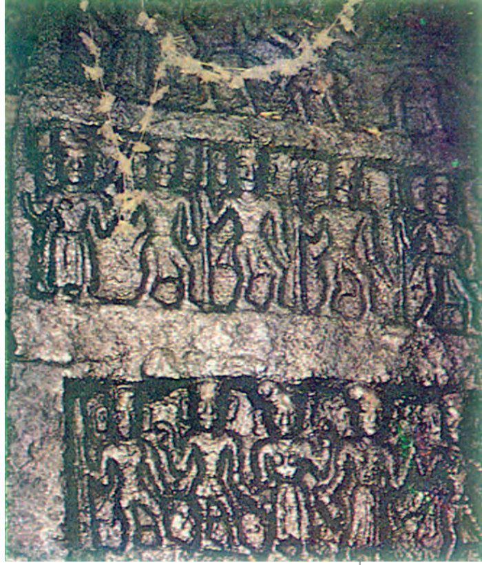
चित्र 8.7 – पंच पांडव, तमिलनाडु के नीलगिरि के जंगलों में पाँच पांडवों को दर्शाता नक्काशीदार पत्थर। इरूला जनजाति द्वारा मंदिर में इस पत्थर को सुरक्षित रखा गया है, जो इस बात का स्मरण कराता है कि पांडव इस क्षेत्र से गुजरे थे।

अंत में हमें यह याद रखना चाहिए कि भारतीय संस्कृति विविधता को संपन्नता के रूप में प्रचारित करती है, किंतु साथ ही विविधता को पोषित करने वाली अंतर्निहित एकता को भी दृष्टि से ओझल नहीं होने देती है।