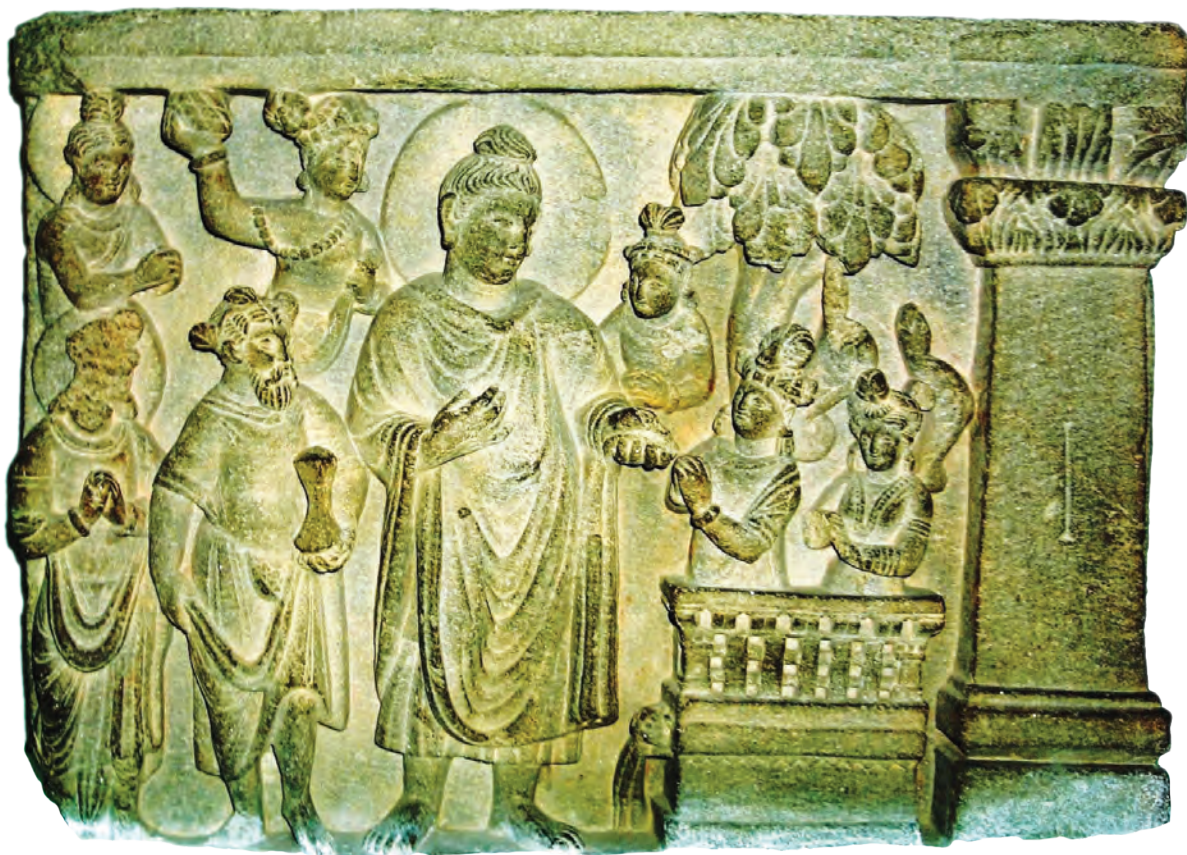
लगभग 1800 वर्ष पुरानी पत्थर की कृति जिसमें बुद्ध उपदेश देते हुए दर्शाए गए हैं।