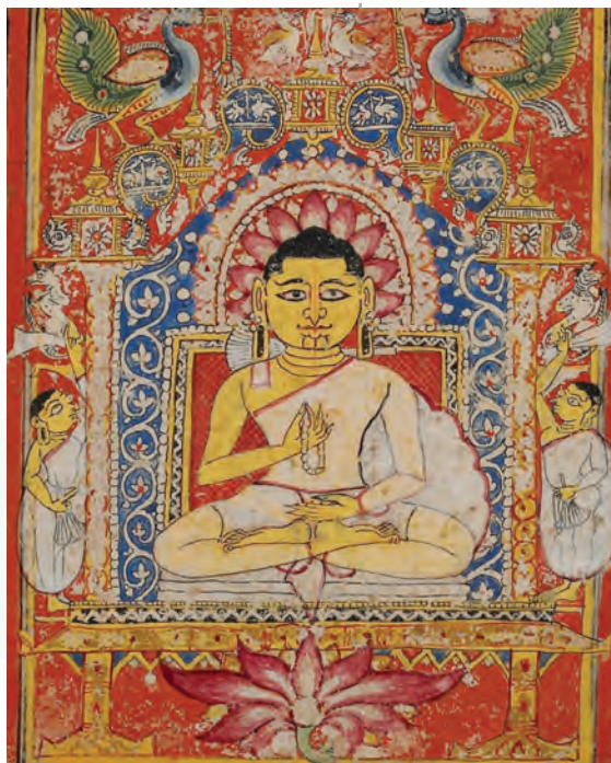
महावीर वर्धमान का एक पारंपरिक चित्र

खोज का निर्णय लिया। उन्होंने संन्यासी जीवन के अनुशासन का पालन किया और 12 वर्ष बाद उन्हें ‘अनंत’ ज्ञान या सर्वोपरि विवेक प्राप्त हुआ। उन्हें ‘महावीर’ या ‘महानायक’ के नाम से जाना जाने लगा और उन्होंने अपने अर्जित ज्ञान का उपदेश देना आरंभ किया।