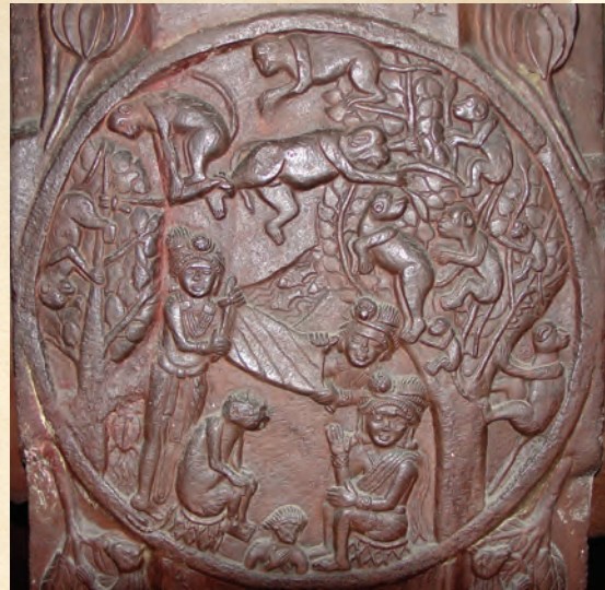
वानर-राज की कथा दर्शाने वाली पत्थर की कृति (चित्र – मध्यप्रदेश)

एक प्रसिद्ध कथा में, बुद्ध वानरों के एक बड़े समूह के राजा थे। वे एक विशालकाय वृक्ष के समीप रहते थे जिस पर मीठी सुगंध वाले और स्वादिष्ट फल लगे हुए थे। वानर-राज के आदेश के बावजूद कि उस वृक्ष का कोई भी फल किसी और के हाथ न लगे, एक दिन एक पका हुआ फल नीचे नदी में जा गिरा। पानी की धारा के साथ बहकर वह फल जाल में फँसा और उसे राजमहल ले जाया गया। राजा उस फल के स्वाद से इतना सम्मोहित हुए कि उन्होंने अपने सैनिकों से उस फल के वृक्ष को ढूँढ़ निकालने के लिए कहा।