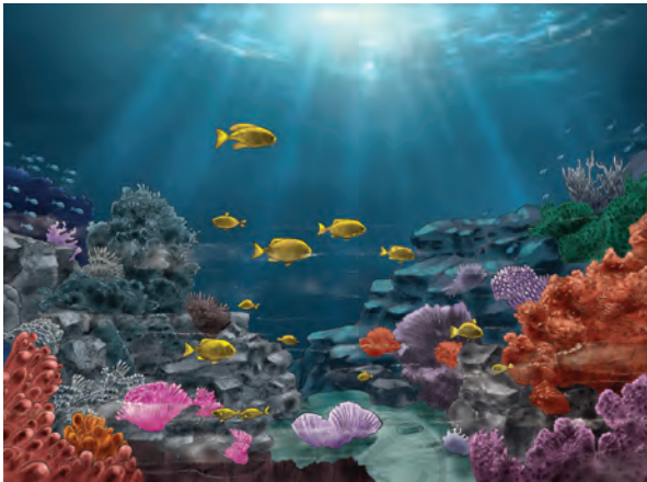
समुद्र के भीतर का दृश्य

अंतरिक्ष की व्यापकता तक और रसोई में पक रहे व्यंजनों से लेकर खेल के मैदान तक सबसे अभूतपूर्व खोज ऐसे ही अकल्पनीय स्थानों में हुई हैं।