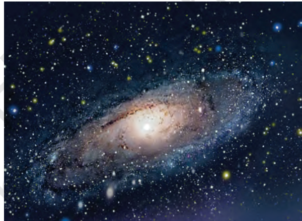
मंदाकिनी (आकाश गंगा)

विज्ञान एक व्यापक और अंतहीन जिगसाँ पहेली जैसा है। हमारे द्वारा की गई प्रत्येक नई खोज इस पहेली का एक और टुकड़ा जोड़ देती है और आपको पता है कि यही तो इस पहेली की सबसे अच्छी बात है! इसकी कोई सीमा नहीं है कि हम क्या-क्या खोज सकते हैं क्योंकि ज्ञान का हर नया भाग नये प्रश्नों तथा खोजों की ओर ले जाता है। हम कभी-कभी देखते हैं कि इस पहेली का एक टुकड़ा गलत स्थान पर जोड़ दिया गया है और उसे वहाँ से दूसरे स्थान पर ले जाने की आवश्यकता है। नई खोजें प्रायः विश्व के बारे में हमारी समझ बढ़ाती है।