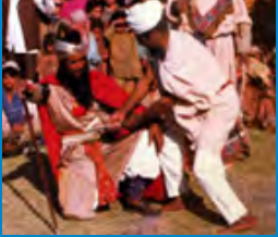
بھانڈپا تھیٹر، کشمیر