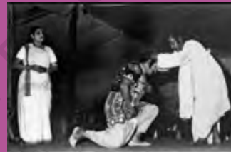
جائز، مغربی بنگال