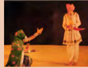
ماج، مدھیہ پردیش