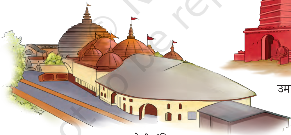
कामाख्या देवी मंदिर