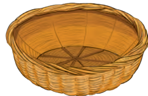
सब्जी की टोकरी