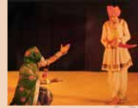
माच, मध्य प्रदेश