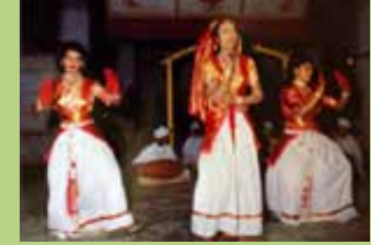
अंकिया नाट, असम