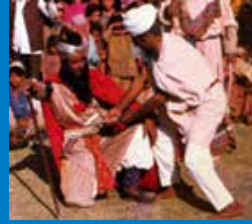
भांड पाथेर, कश्मीर