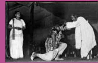
जात्रा, पश्चिम बंगाल